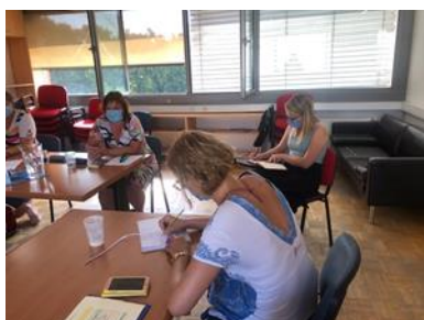
Z maskami na obrazu na sestanku Slovenske EAPN